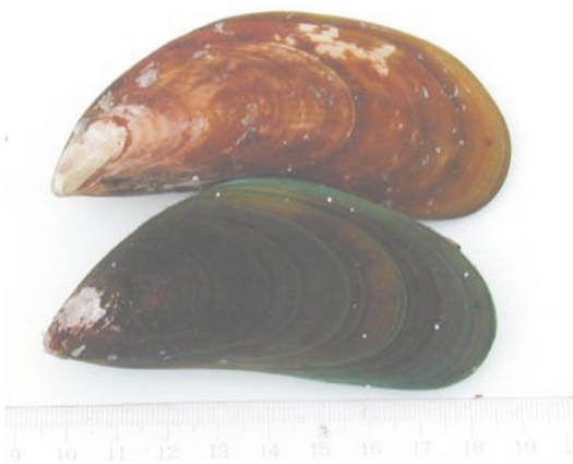
図1 ミドリイガイ(上は沖縄県塩屋湾の標本, 下は愛知県名古屋港の標本)

ミドリイガイは二枚貝綱、糸鰓目、イガイ科、 Perna 属に属します。その英名はgreen musselまたは green-lipped musselです。殻は長卵形でやや薄く、殻の内面は白色です。殻表面の色調は茶褐色が主体で腹縁部に細い帯状の「緑唇」がみられるものと、暗緑色が主体で腹縁部がやや巾の広い鮮やかな緑色帯がみられるものがあります。殻表面の色調は、生息場所や照度などによって異なるものと推察されています。我々も沖縄県塩屋湾で茶褐色の個体、愛知県名古屋港で暗緑色の個体を採集しました(図1)。